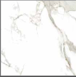
N 914 aura