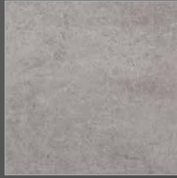
N 912 kreta