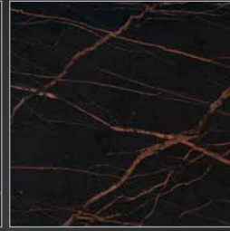
N 911 laurent