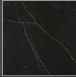
N 913 kelya