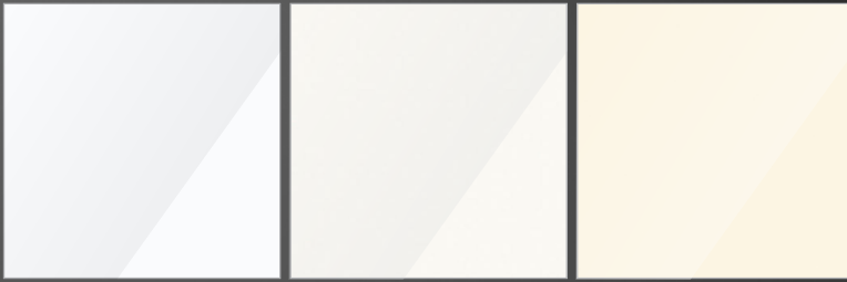
A 127 arctic white