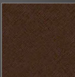
Y 235 madreperlato