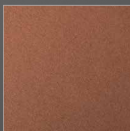
Y 238 cupro