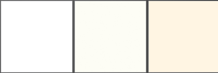
K 257 artic white xt