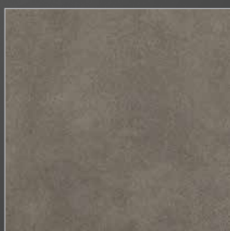
K 282 parana