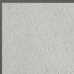
K 279 grande