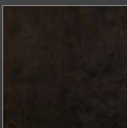
K 245 glauco