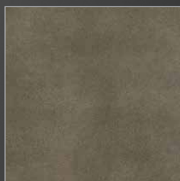
K 281 colorado