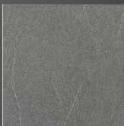
K 284 masieri