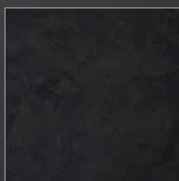
K 247 zementschwarz